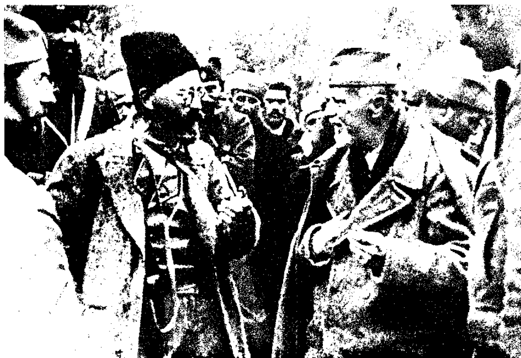
דרז'ה מיכאילוביץ' ויועצו הפוליטי דרגישה וואשיץ' על הר זלאטאר, יולי 1942