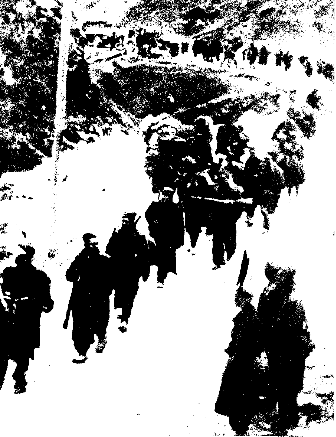
גדוד פרטיזאני בדרכו לפרוזור, מארס 1943