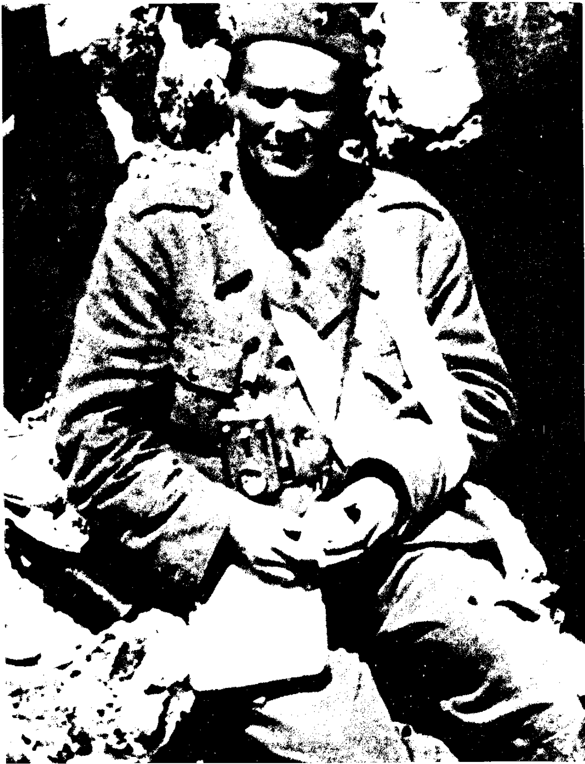
טיטר, אחרי הפציעה על הר אורזן, יוני 1943