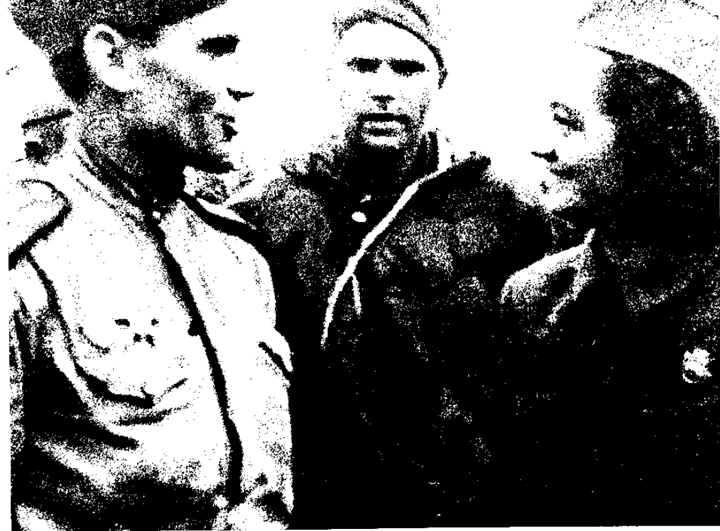
מיטרה מיטרוביץ' ג'ילאס בחברת קצינים סובייטיים, אוקטובר 1944