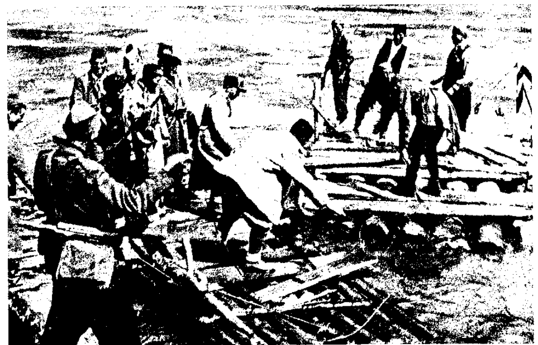
יחידות פרטיזאניות בעת צליחת נהר הדרינה, מאי 1943