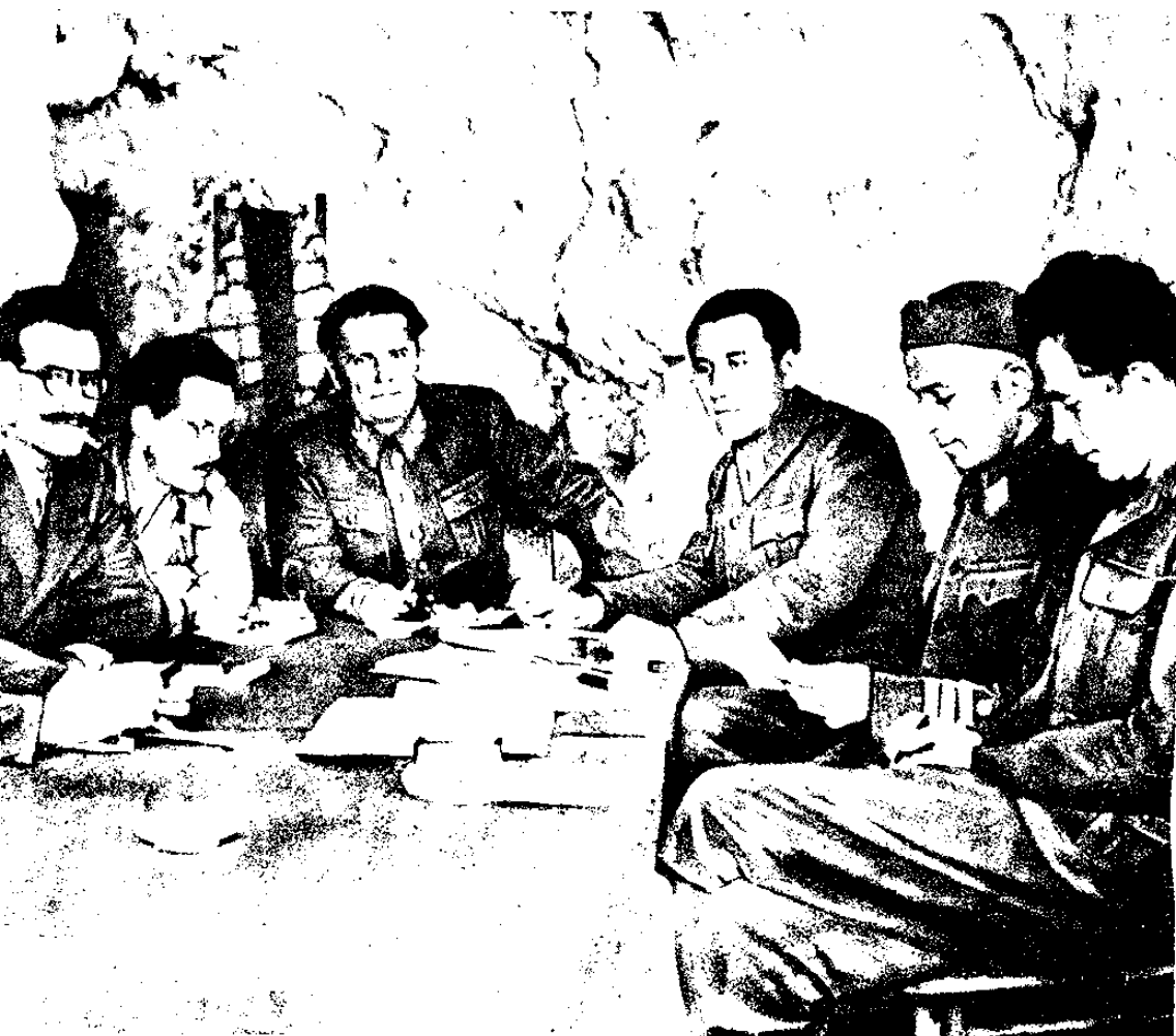
הפיקוד העליון באי ויס, קיץ 1944. משמאל לימין: וולדימיר באקאריץ', איזואן מילוטנינוביץ', אדוארד קארדל, יוסיפ ברוז טיטו, אלכסנדר-ליוקה ראנקוביץ', סוטוזאר ווקמאנוביץ' ומילאוואן ג' ילאס