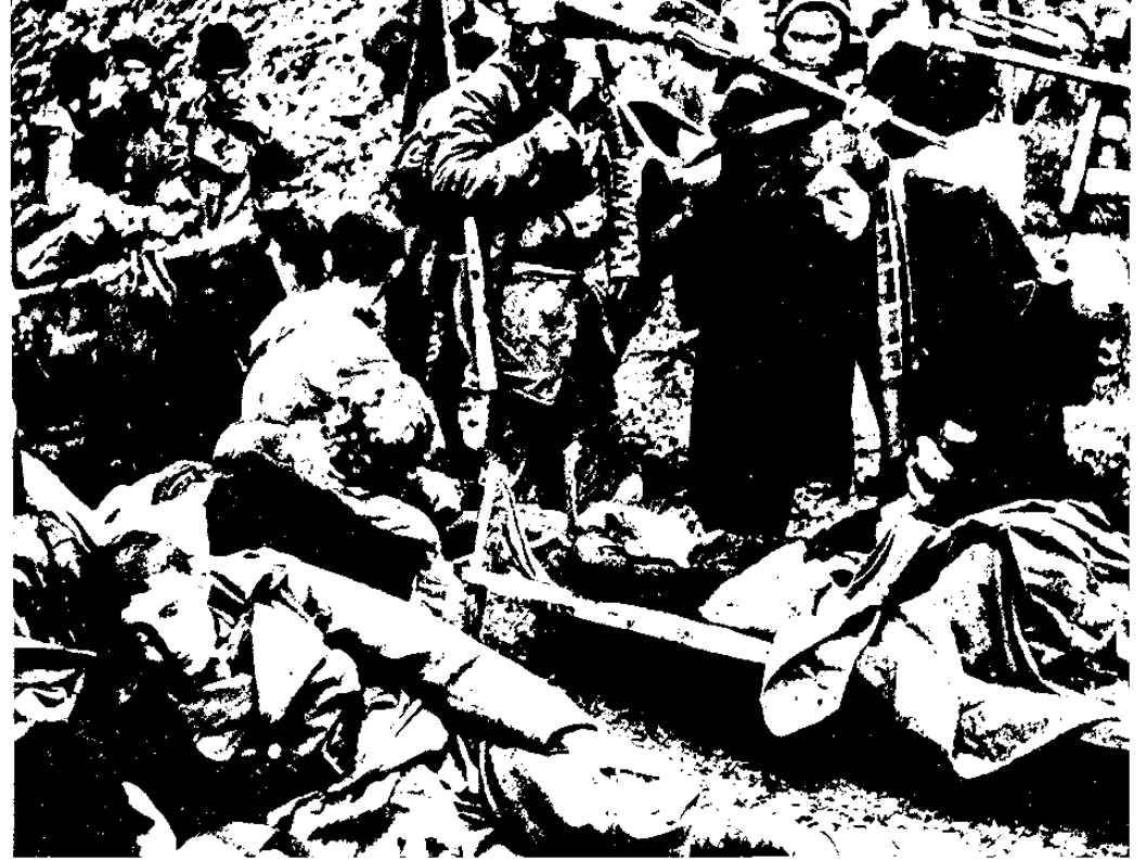
פארטיזאנים פצועים בבוסניה, יוני 1943